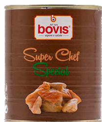
BC0636 Cep laminat gran xef 1 Kg.

Una selecció de productes en conserva d'origen italià, d'alta qualitat. Ideal per guarnir la teva pizza.