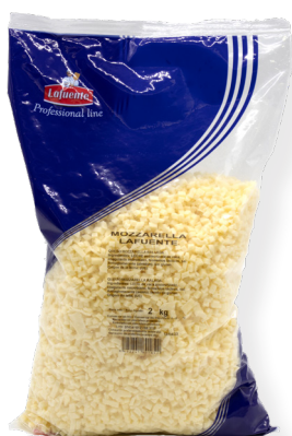
KV7414 Mozzarella Tacos +

Un element imprescindible de la pizza, és la mozzarella. És essencial que els productes bàsics siguin de qualitat. Els sabors bàsics de la pizza són els més importants!