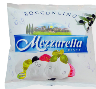
KV9345 Mozzarella fresca 125g. 6 u.