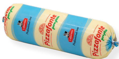
KV0733 Mozzarella Barra 1 Kg.