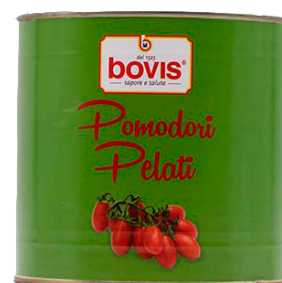
BC1615 Tomàquet pelat 3 Kg.