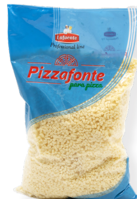
KV7974 Preparat Pizzafonte Tacos