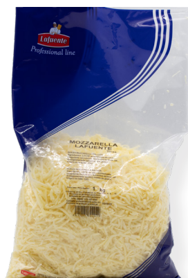
KZ7717 Mozzarella Filada 1 Kg. +