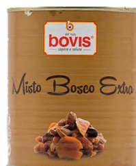
BC0642 Bolets barreja llauna 1 Kg.