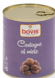
BC1213 Castanyes amb mel llauna 1 Kg.