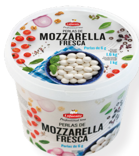
KV8286 Mozzarella fresca Perles 1 Kg.