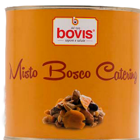
BC0644 Barreja bolets càtering 3 Kg. +