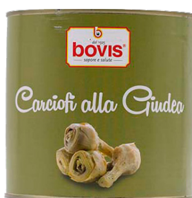
BC0826 Carxofes amb cua llauna 3 Kg. +