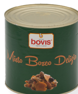
BC0650 Bolet barreja delicia 3 Kg. +