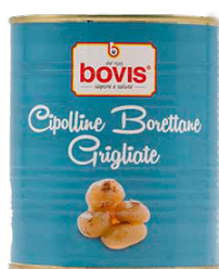
BC9999 Cebeta a la graella llauna 1 Kg. +